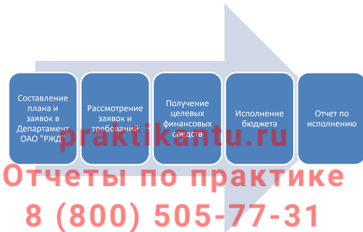
Рис. 2. Финансовое планирование в организации

Финансовое планирование в организации может быть представлено схематично.