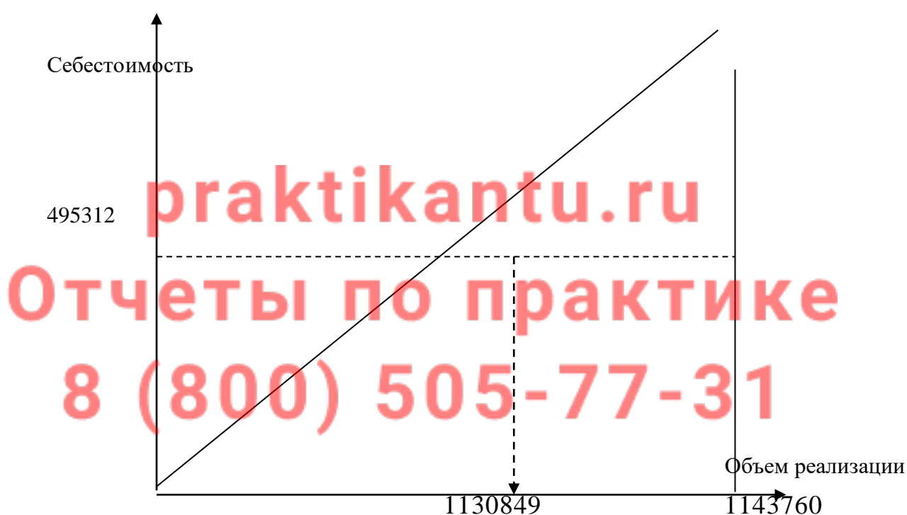
Рис. 2. Положение точки безубыточности

Графически точка безубыточности имеет следующий вид: